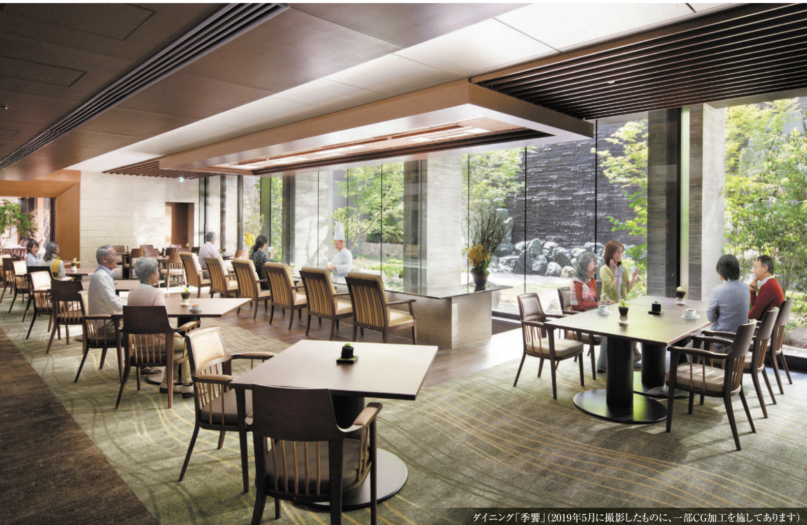
ダイニング「季饗」(2019年5月に撮影したものに、一部CG加工を施してあります)