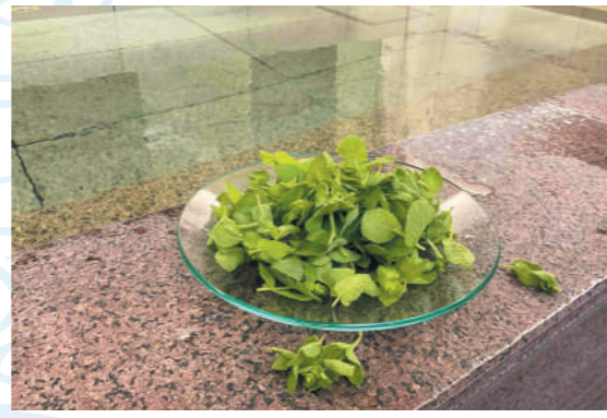
〈8月：ミント湯〉 無農薬のフレッシュミントを使い、爽やかで清涼感のある香りに包まれるミント湯をつくりました。ミントには、体を温める効果もあり、冷房による冷え気になるこの時期におすすめです。