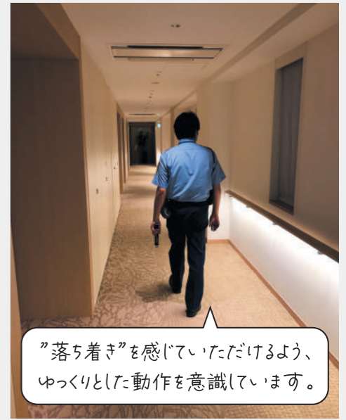
”落ち着き”を感じていただけるよう、ゆっくりとした動作を意識しています。

平常時は全ての動作や会話について、ゆっくりとしたペースで行うことを心掛けています。本来警備の仕事はキビキビとした動作が求められることが多いのですが、「パークウェルステイト浜田山」ではご入居者様に対して「落ち着き」をご提供することが大切なサービスのひとつと考えており、不要な緊張感や堅苦しさをお見せする事のないよう心掛けています。防犯カメラだけに頼るのではなく、夜間も有人できちんとレジデンス内を見守っています。