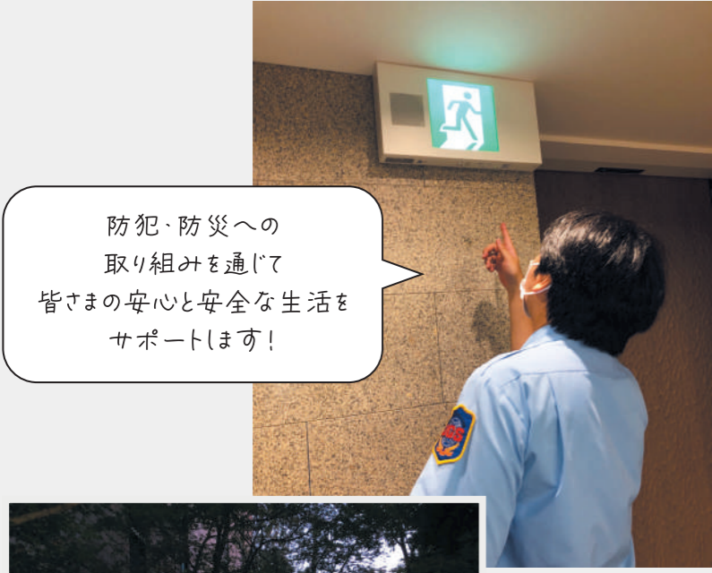
防犯・防災への取り組みを通じて皆さまの安心と安全な生活をサポートします！