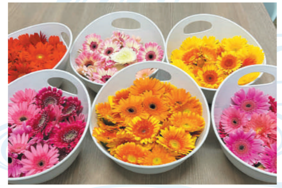
〈9月：菊湯（ガーベラ湯）〉 菊は厄を払い、長寿を得る薬と言われることから広まった菊湯。1輪1輪丁寧に浮かべ、見ているだけでも楽しげな気持ちになれる菊湯を目指しました。