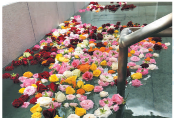
〈2月：薔薇湯〉 バレンタインイベントの一環として、薔薇の花を贅沢に浮かべた華やかな薔薇湯をご提供しました。大浴場前のハワイエではアロマも焚いて、リラックス空間を演出しました。

パークウェルステイト浜田山の大浴場では、四季を感じる季節湯を毎月開催しています。