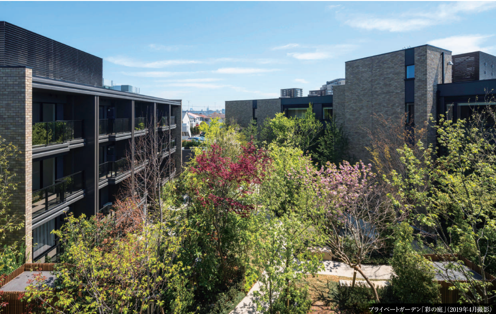
プライベートガーデン「彩の庭」(2019年4月撮影)