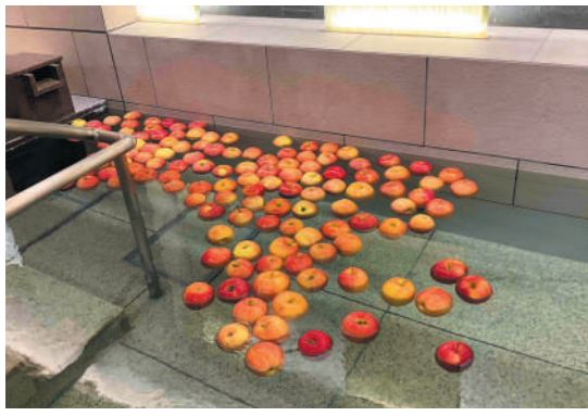
〈11月：りんご湯〉 秋の果物の代表格・りんご。色合いの違う3種類のりんごをご用意し、カラフルでにぎやかなりんご湯をご提供いたしました。りんごのほんのりと甘い香りに包まれ、ご好評でした。