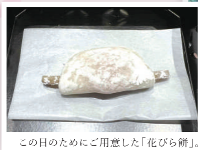
この日のためにご用意した「花びら餅」。