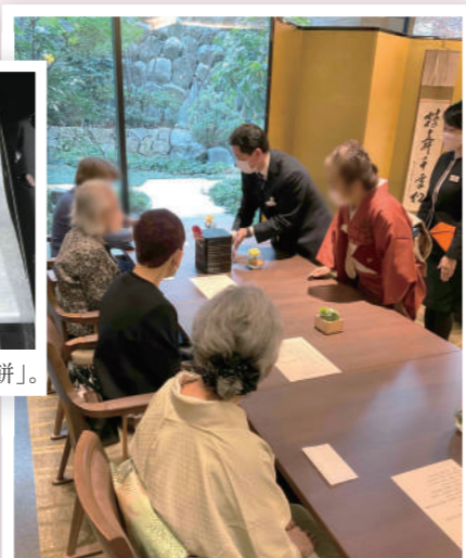
“和”を感じる機会となりました。