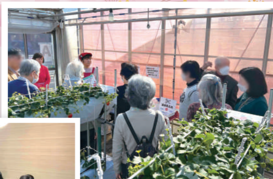
お好みの品種は見つかりましたか？