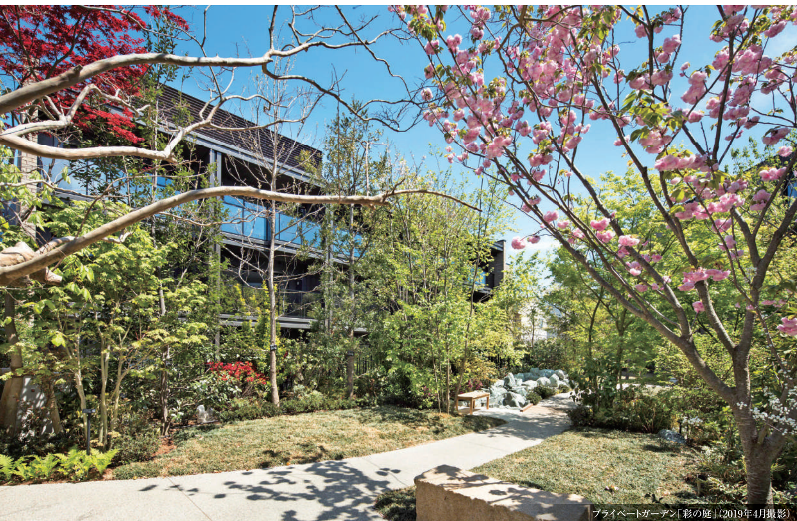
プライベートガーデン「彩の庭」(2019年4月撮影)