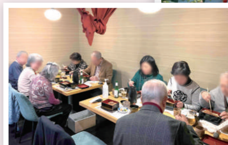
極上の鰻とお酒を堪能！